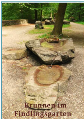
Brunnen im Findlingsgarten